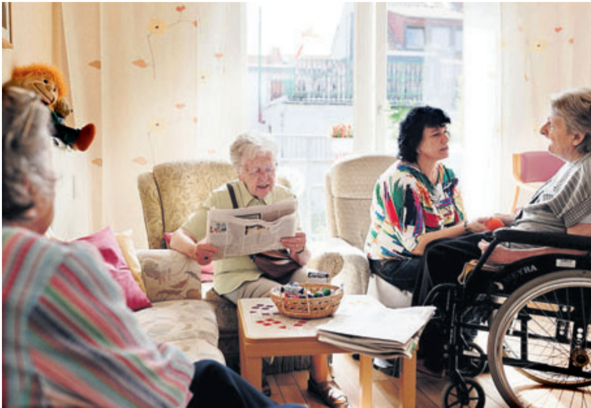
Im Gemeinschaftsraum der Wohngemeinschaft treffen sich Bewohner und Pflegepersonal. So muss niemand alleine auf seinem Zimmer Zeit verbringen, und es bleibt immer Zeit, um zwischendurch auf kleine Bedürfnisse einzugehen.