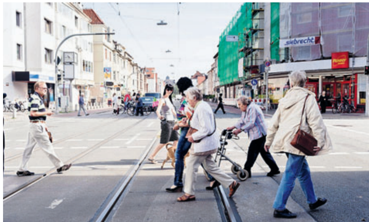
So weit möglich genießen die WOG-Bewohnerinnen ihre Mobilität und brechen gerne zu kleinen Ausflügen in der Neustadt auf. Zum Friseur oder zum Markt führt der Weg und bringt willkommene Abwechslung.