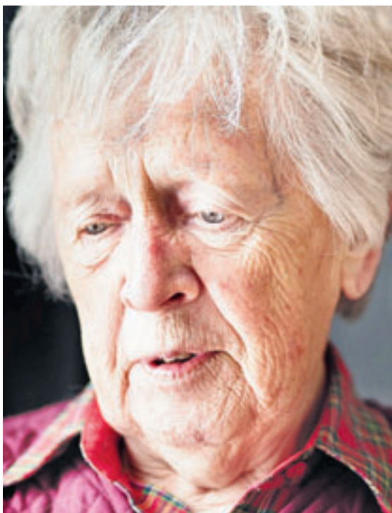
Jeder Bewohner bringt die Erfahrung eines ganzen Lebens mit in die Wohngemeinschaft.