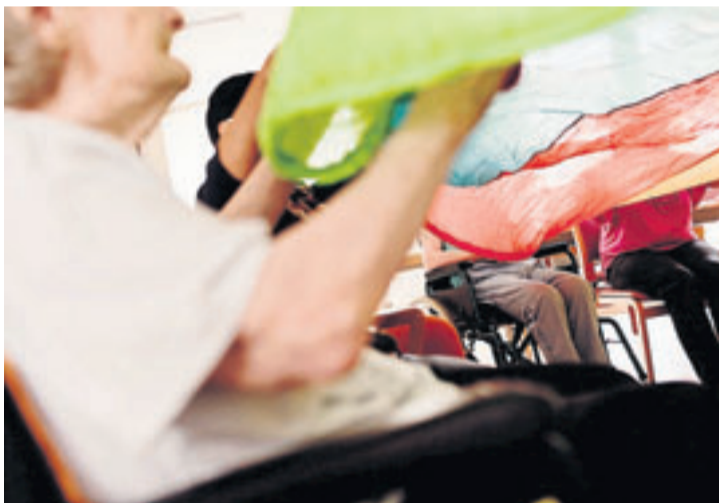
Demenzranke ziehen sich immer weiter in ihre Gefühlswelt zurück. Für die Betreuer heißt das, dass sie den Bewohnern auch auf dieser Ebene begegnen müssen, um sie abzuholen.

Zwischen schmalen Beeten, in denen Blumen und Büsche wachsen, erstreckt sich in der Neustadt eine Wohnanlage, in deren oberem Stockwerk sich eine besondere Wohngemeinschaft eingerichtet hat. Hier leben sieben Menschen mit Demenz zusammen in einem sehr kleinen familiären Umfeld, das ihnen dabei hilft, mit ihrer Krankheit zurechtzukommen.