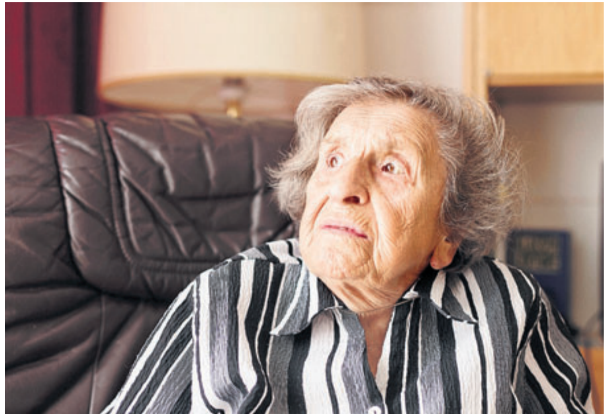
Oft schweifen die Gedanken der WOG-EBewohner ab. Die Betreuer sorgen dafür, dass sich die Senioren nicht verlieren, außerdem sorgen feste Strukturen für den nötigen Halt im Alltag.